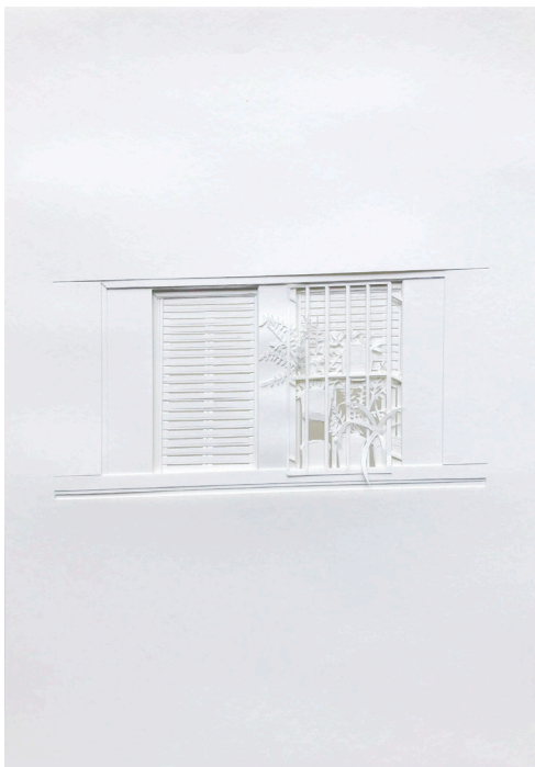
Defensa 629. 2020 Calado sobre papel. 30 x 21 cm