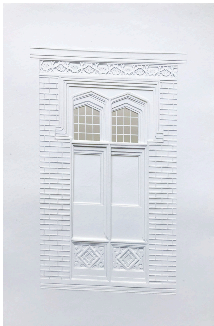
Charcas 2790, 2020 Calado sobre papel 30 x 21 cm