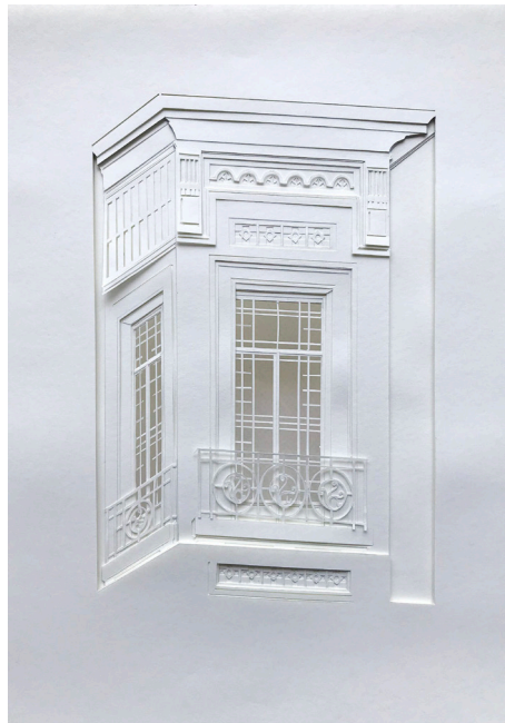
Tacuari 88 Calado sobre papel 30 x 21 cm